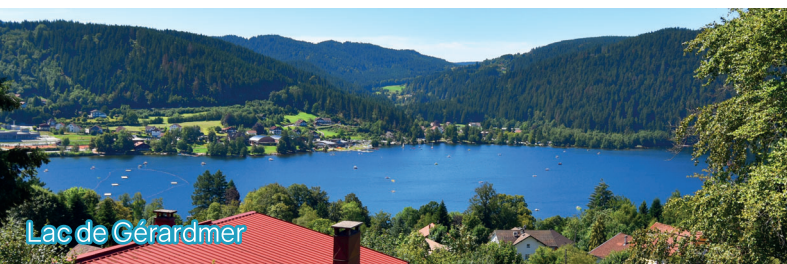
Lac de Gérardmer

Ce programme est proposé à titre indicatif, il peut être soumis à modification tout en conservant les critères du programme SENIORS EN VACANCES.