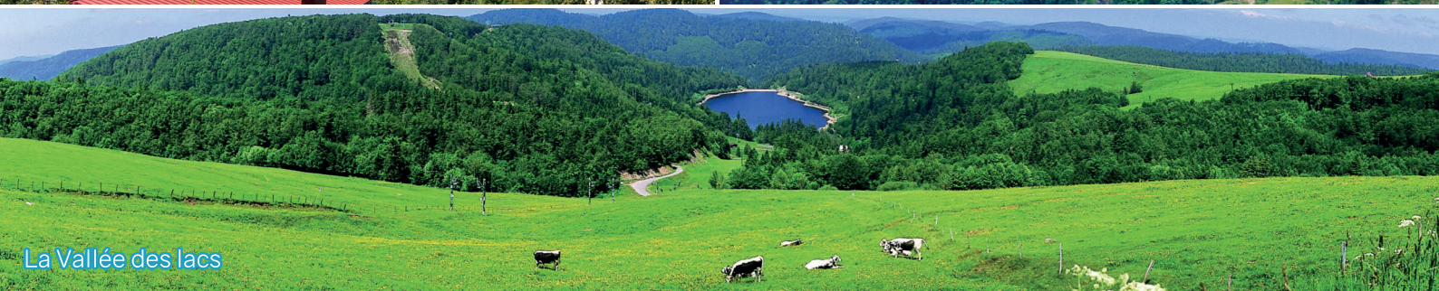
La Vallée des lacs