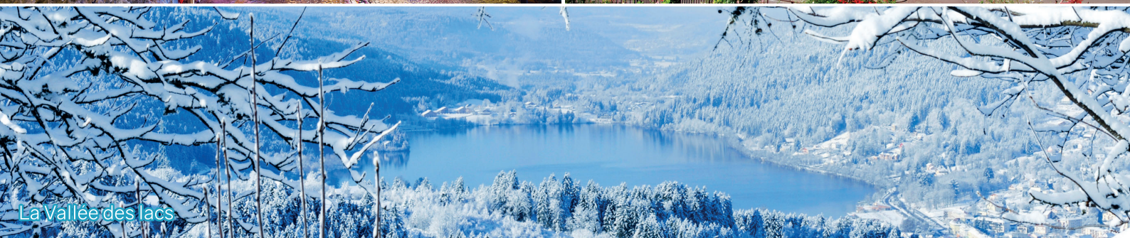
La Vallée des lacs