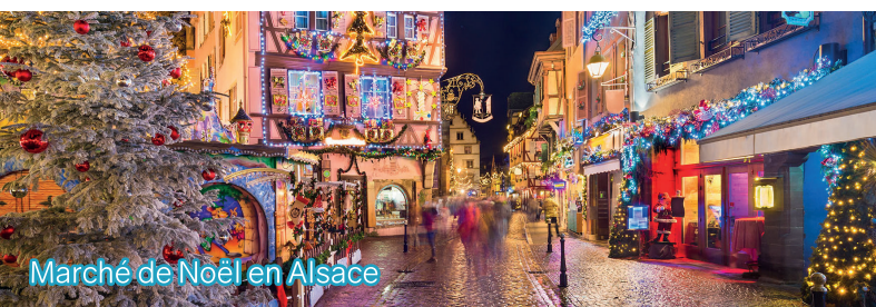
Marché de Noël en Alsace

Ce programme est proposé à titre indicatif, il peut être soumis à modification tout en conservant les critères du programme SENIORS EN VACANCES.