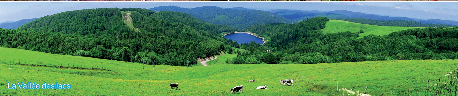
La Vallée des lacs