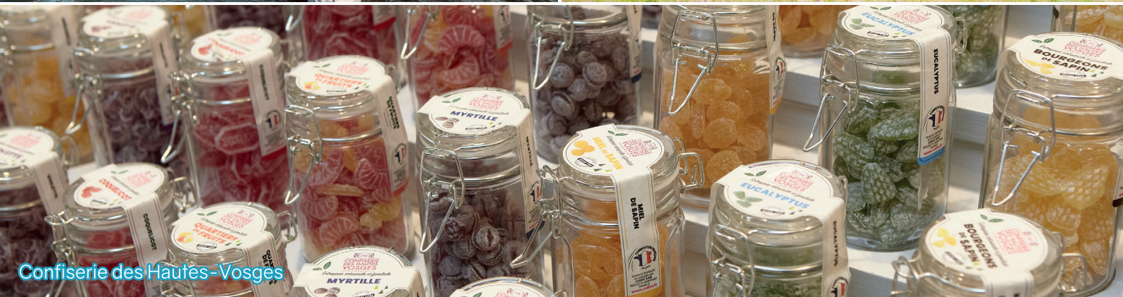
Confiserie des Hautes-Vosges