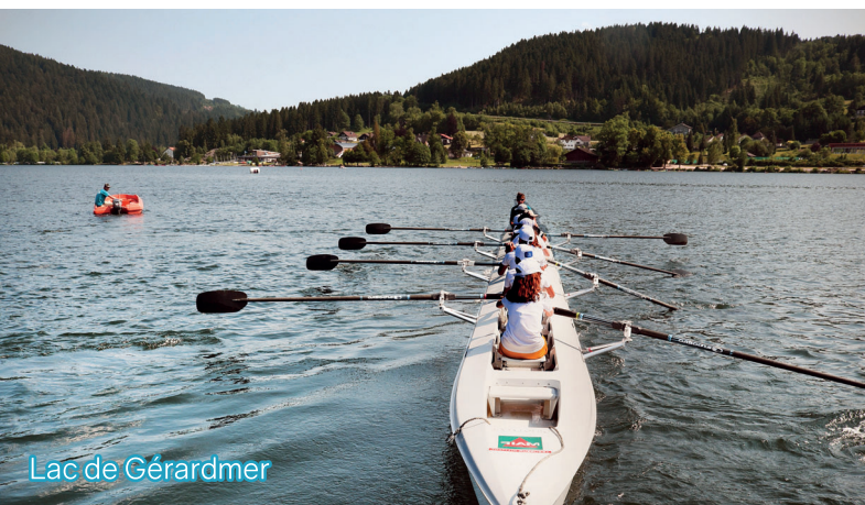
Lac de Gérardmer

Ce programme est proposé à titre indicatif, il peut être soumis à modification tout en conservant les critères du programme SENIORS EN VACANCES.