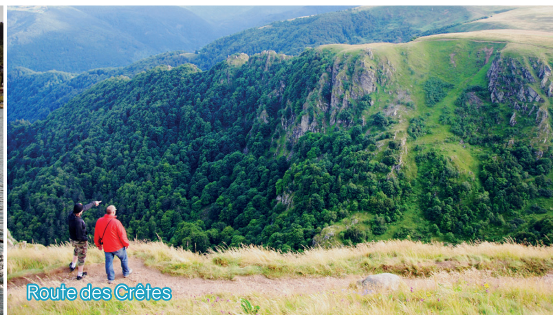
Route des Crêtes