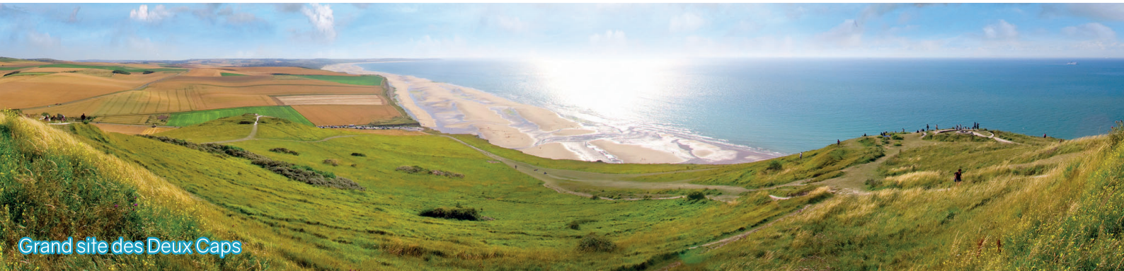
Grand site des Deux Caps